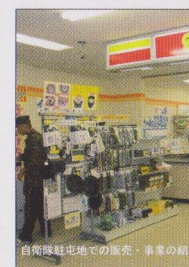
オフセット商品の販売と事業概要の紹介

しかし、管理放棄された竹林、いわゆる放棄竹林が福岡県内でも増加傾向にあります。当社のオフセット・プロジェクトは放棄竹林に対する関心喚起と、サステイナブルな素材としての竹の環境的重要性、郵便ヘルメットなど多様なアイデア製品の開発販売を通じて地域活性化のヒントとなる竹の可能性を訴求する目的を込めています。