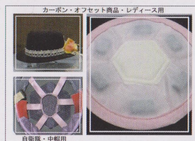
オフセット商品の紹介

年間生産量での総オフセット量は前者で約 1.5t、後者で約 9t となり、併せて 11t となります。